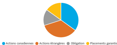
Placements de Corrine

Voici à quoi ressemble la combinaison de placements de Corrine après sa discussion avec son conseiller. Elle recherche toujours la croissance de son épargne, car la retraite est encore loin. Mais maintenant, certains de ses titres les plus risqués ont été remplacés par des placements plus sûrs en titres garantis et en obligations. Elle peut traverser sans crainte les hausses et les baisses du marché.